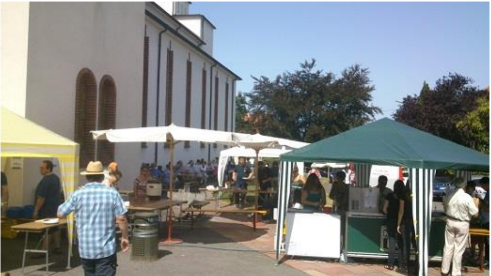
(Impression vom Pfarrfest 2012)

wie Forellen vom Grill mit Kartoffelsalat. Auch das Salatbuffet ist bestens bestückt und ebenfalls sehr zu empfehlen. Das Essensangebot bietet aber auch verschiedene Rostwürste und Pommes-frites. Bei hoffentlich herrlichem Sommerwetter kann man sich auch mit unserem bekannten Eissorbet erfrischen. Sie sehen, wir haben an alles was dem Geist, der Seele und dem Leib gut tut, gedacht. Es lohnt sich sicherlich, bei uns vorbei zu schauen. Wir würden uns sehr über Ihren Besuch freuen. Der Pfarrgemeinderat